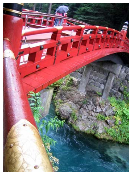
Most Shinkyo w Nikko

W Japonii studenci wybierają laboratorium, w którym chcą pracować. Te zaś są prowadzone przez profesorów i nazywane od ich nazwisk. W tym układzie student spędza wiele czasu w swoim laboratorium, gdzie ma swoje stanowisko pracy i nie tylko, np. w naszym były trzy wygodne kanapy i małe zaplecze kuchenne. Studenci mają bezpośrednią styczność z profesorem i resztą zespołu – wspólne lunche, seminaria, wycieczki. Każdy ma swoje zadania, jednak członkowie laboratorium razem funkcjonują jako grupa i tak podejmują ważne decyzje. Wszystko to sprawia, iż atmosfera pracy jest bardzo fajna, nie ma miejsca na niezadowolenie, konflikty. Tak właśnie było i w moim przypadku.