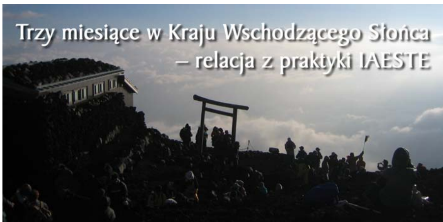
Wschód słońca na Górze Fuji